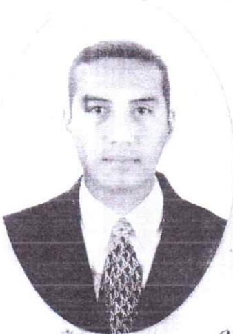
CENTRO SUPERIOR DE ESTUDIOS TURÍSTICOS JALAPA RVOE 0342781 XALAPA, VER.

de Licenciado en Administración de Empresas Turísticas